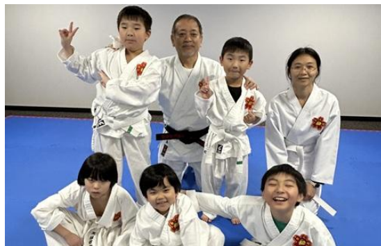
写真・有明道場・宜野座師範と生徒たち

各道場では週 2～3 回程度の稽古日を設け、初心者には基本動作をひとつひとつ丁寧に、上級者には応用技術や分解を重点的に指導するなど、習熟度に応じたきめ細かな個別指導を徹底しています。また、技術の向上・研究・普及を目的として定期的に合同講習会を開催しており、各道場の師範が一堂に会して技術的な意見交換を行うとともに、一般の生徒も参加して普段とは異なる師範から直接指導を受けられる機会を設けています。