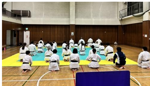
(写真・右) 市川本部道場の様子